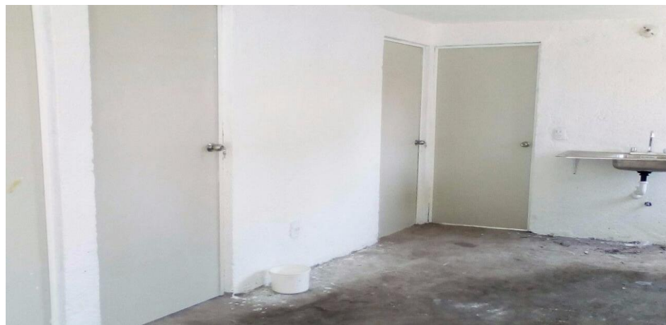
VISTA INTERIOR Y COLOCACION DE TARJA