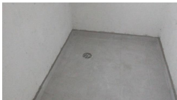
COLOCACION DE LOSETA