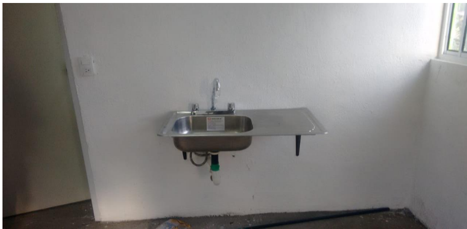
VISTA INTERIOR Y COLOCACIÓN DE TARJA