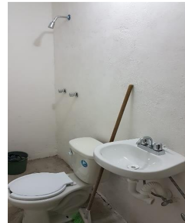
COLOCACIÓN DE MUEBLES DE BAÑO