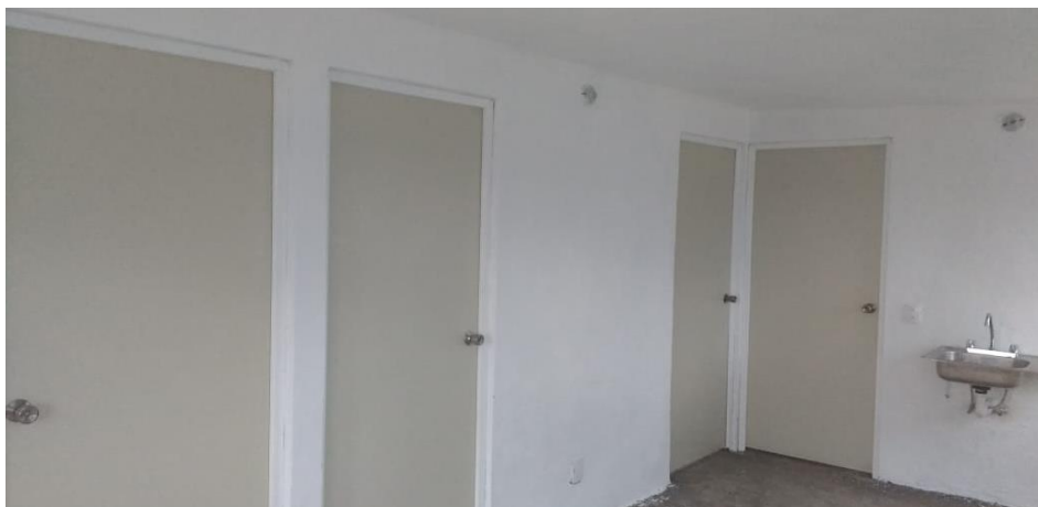
VISTA INTERIOR Y COLOCACIÓN DE TARJA