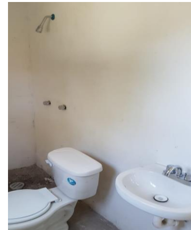
COLOCACIÓN DE MUEBLES DE BAÑO