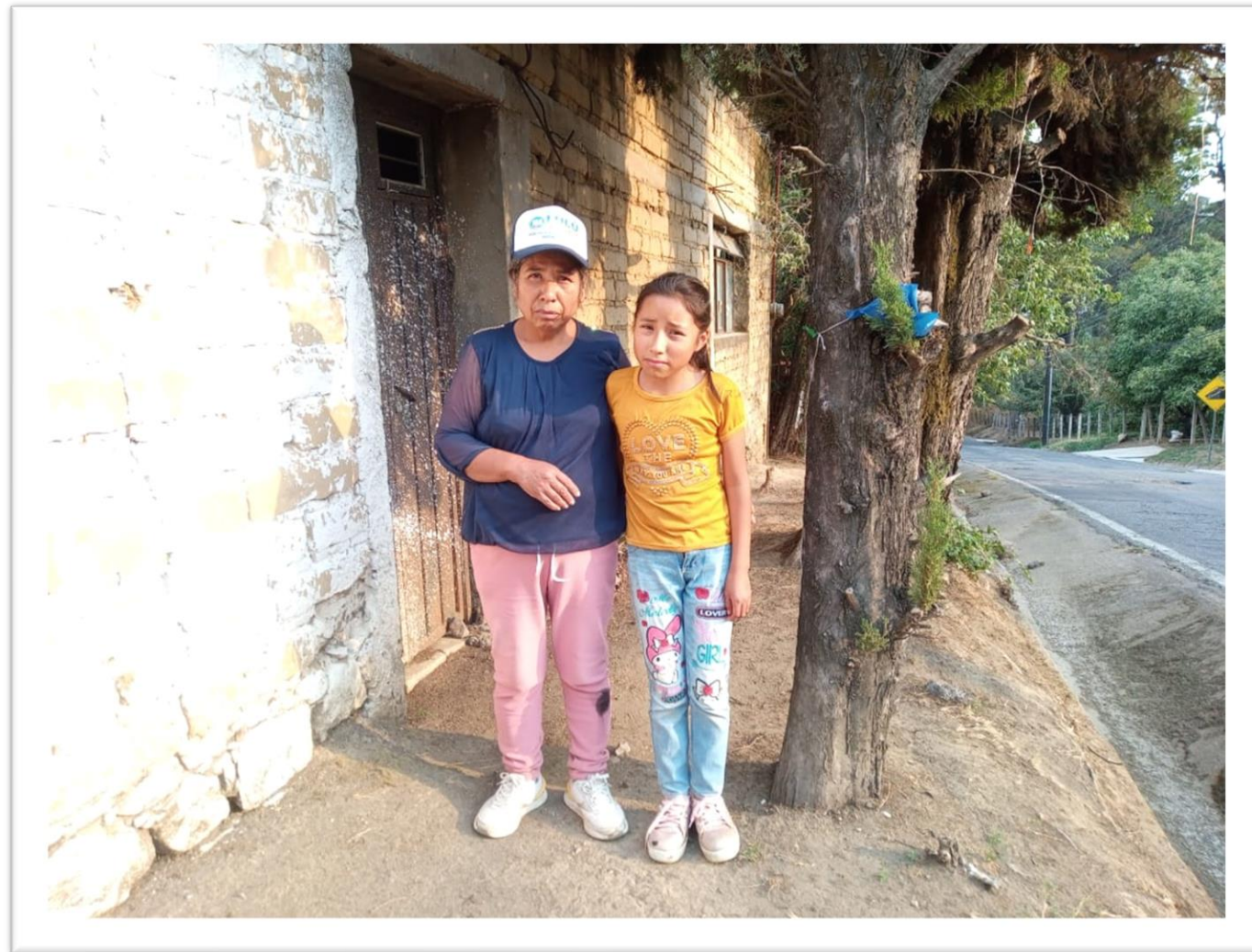
ANTES DE LA INTERVENCIÓN