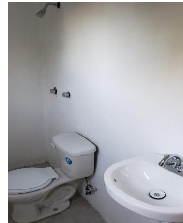
COLOCACIÓN DE MUEBLES DE BAÑO