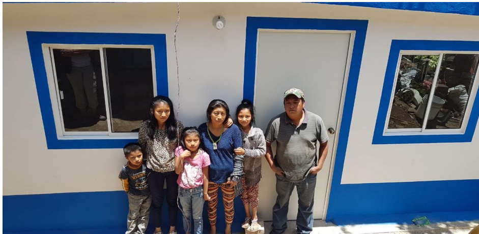
VISTA FACHADA PRINCIPAL