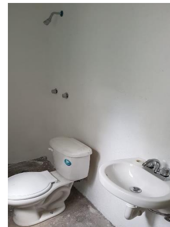
COLOCACIÓN DE MUEBLES DE BAÑO