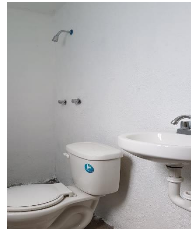
COLOCACIÓN DE MUEBLES DE BAÑO