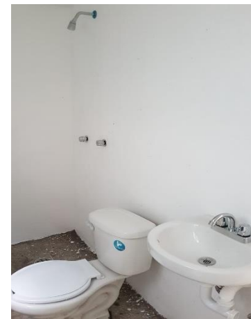
COLOCACIÓN DE MUEBLES DE BAÑO