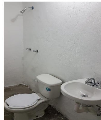
COLOCACIÓN DE MUEBLES DE BAÑO