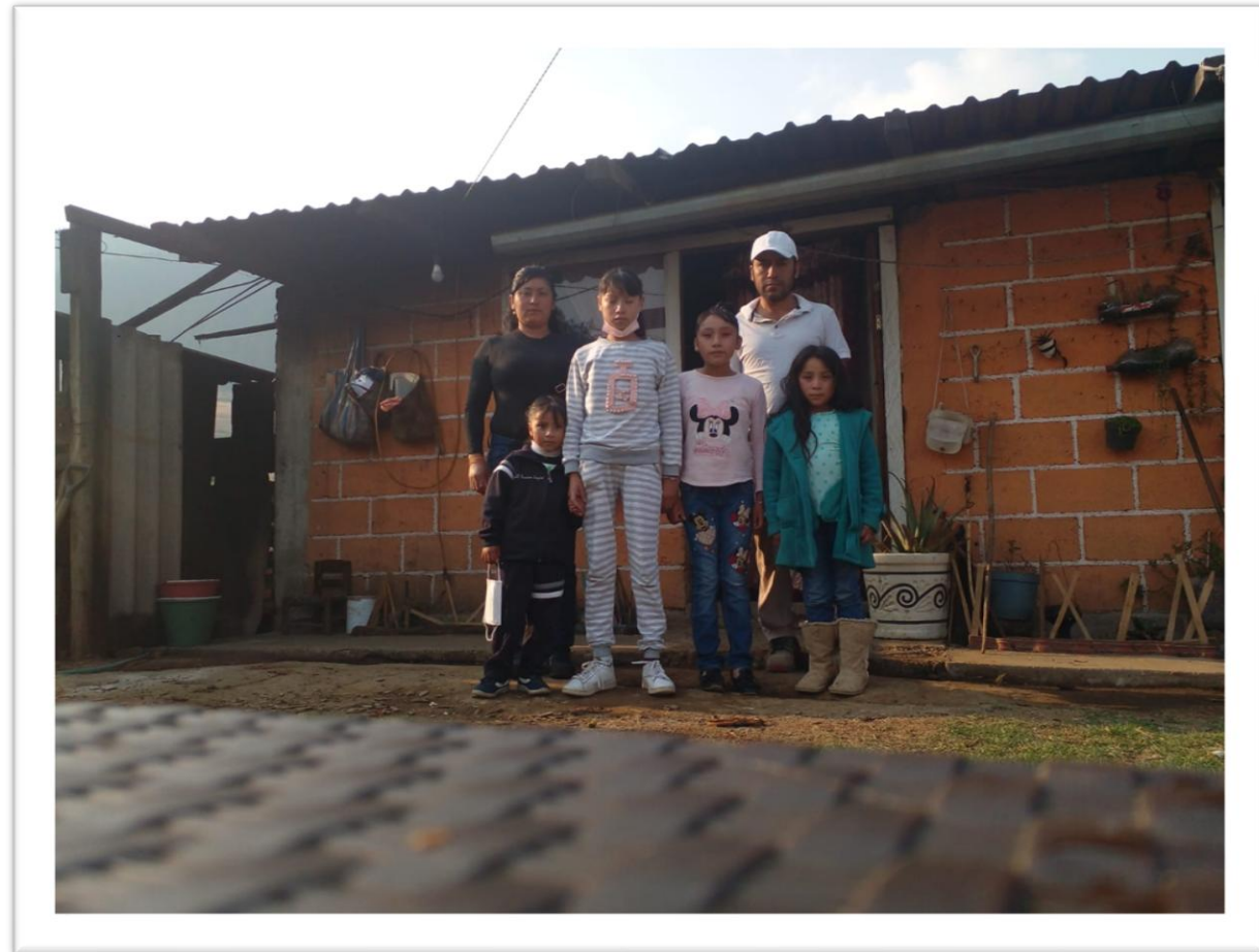
ANTES DE LA INTERVENCIÓN