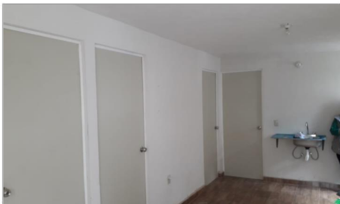
VISTA INTERIOR Y COLOCACIÓN DE TARJA