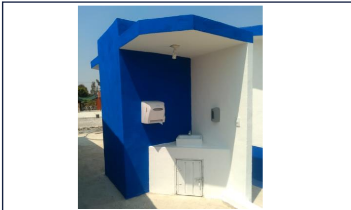
VISTA EXTERIOR ESTACION LAVADO DE MANOS