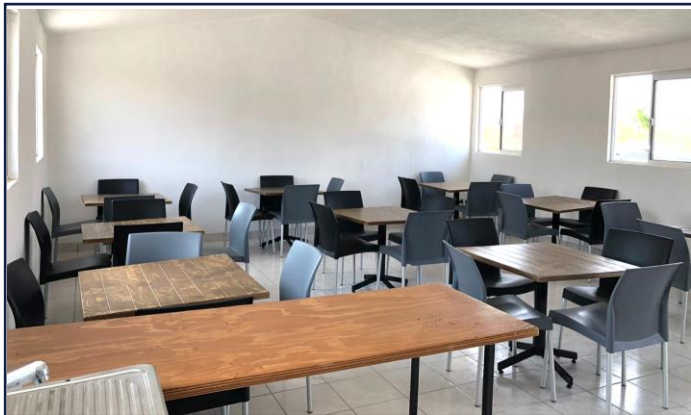
VISTA INTERIOR (COMEDOR)