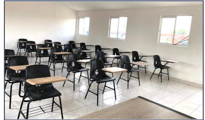
VISTA INTERIOR (AULA ESCOLAR 2)