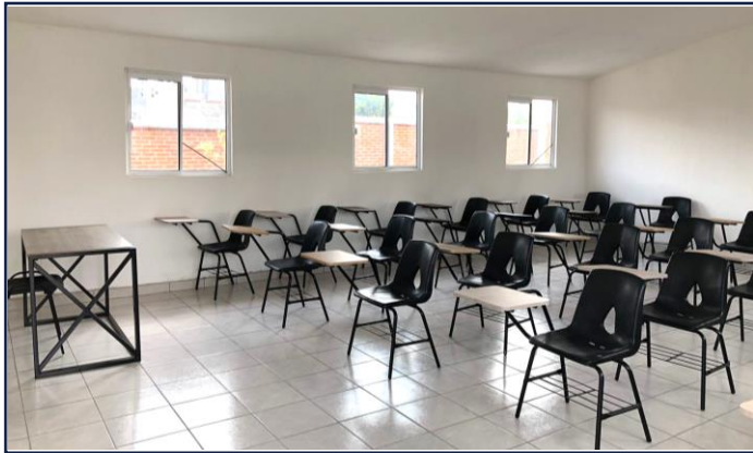
VISTA INTERIOR (AULA ESCOLAR 1)