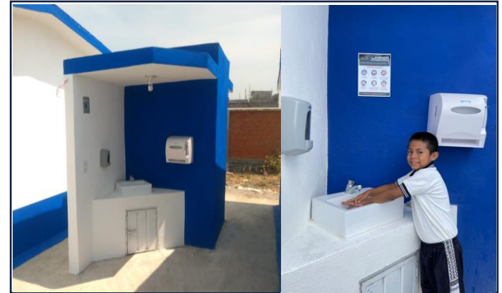
VISTA EXTERIOR ESTACION LAVADO DE MANOS