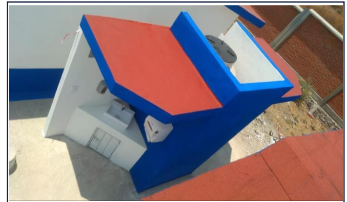
VISTA EXTERIOR ESTACION LAVADO DE MANOS