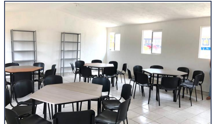
VISTA INTERIOR (BIBLIOTECA)