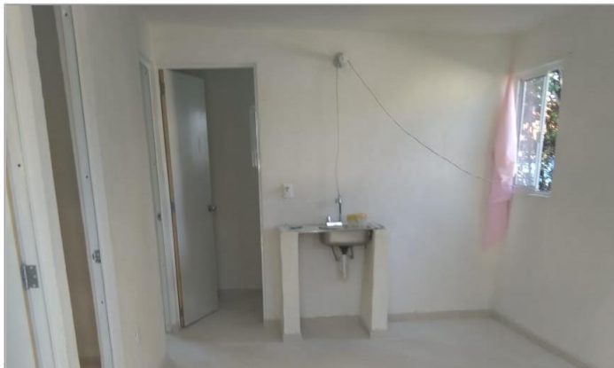
VISTA INTERIOR Y COLOCACIÓN DE TARJA