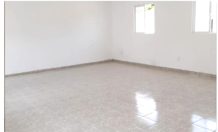
VISTA INTERIOR (AULA 2)