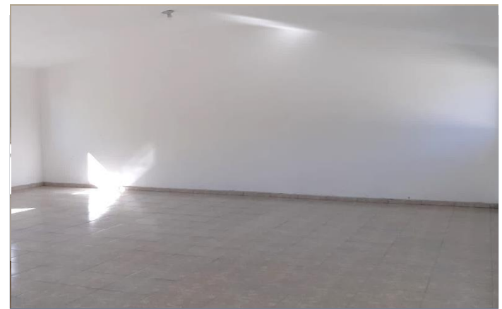
VISTA INTERIOR (AULA 4)