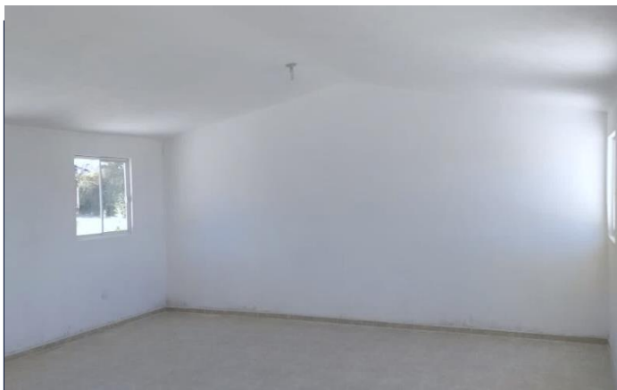
VISTA INTERIOR (AULA 3)