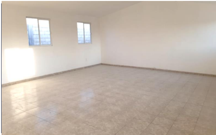
VISTA INTERIOR (AULA 1)