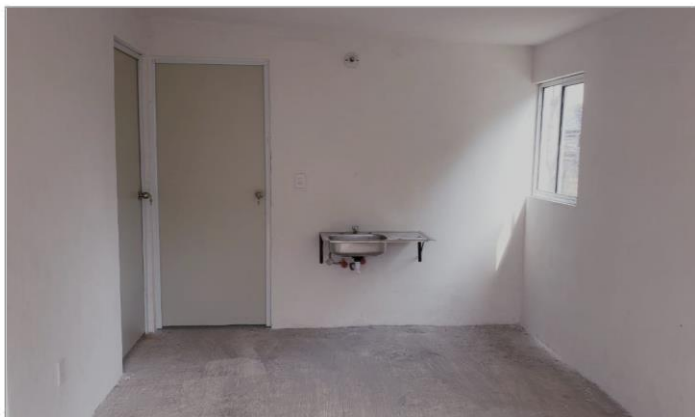
VISTA INTERIOR Y COLOCACIÓN DE TARJA