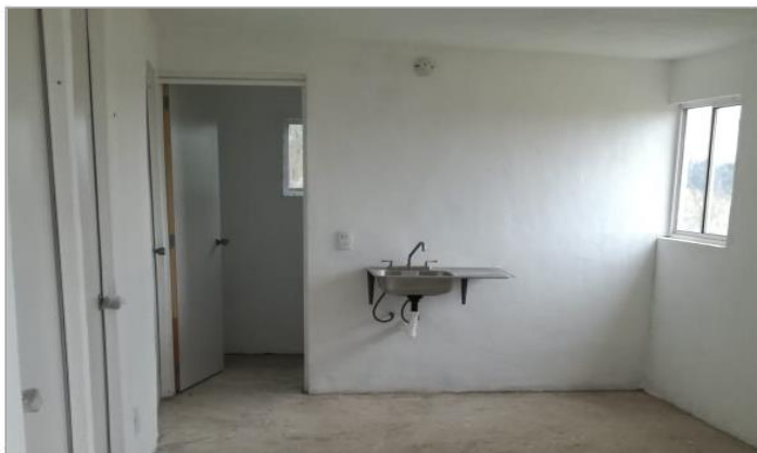
VISTA INTERIOR Y COLOCACIÓN DE TARJA