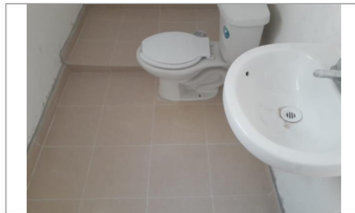
COLOCACIÓN MUEBLES DE BAÑO