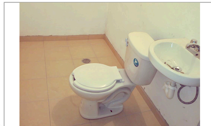
COLOCACIÓN MUEBLES DE BAÑO