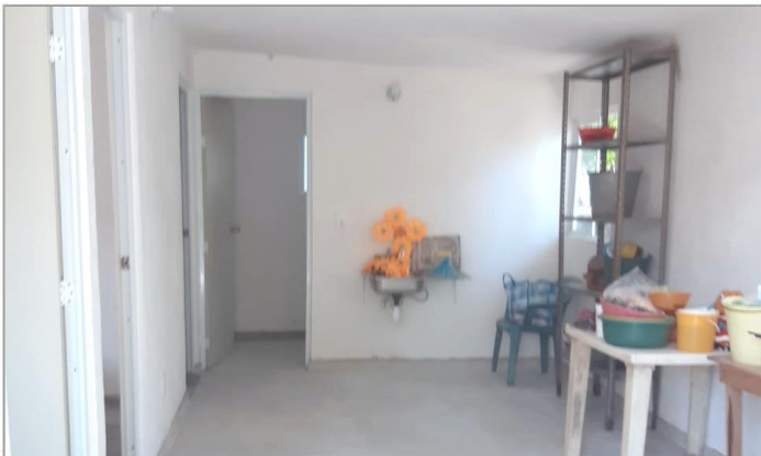
VISTA INTERIOR Y COLOCACIÓN DE TARJA