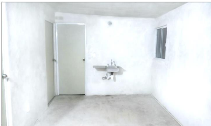
VISTA INTERIOR Y COLOCACIÓN DE TARJA