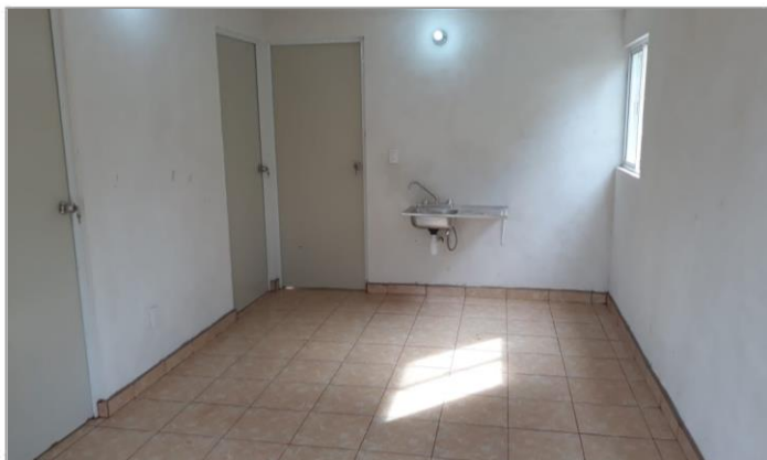
VISTA INTERIOR Y COLOCACIÓN DE TARJA