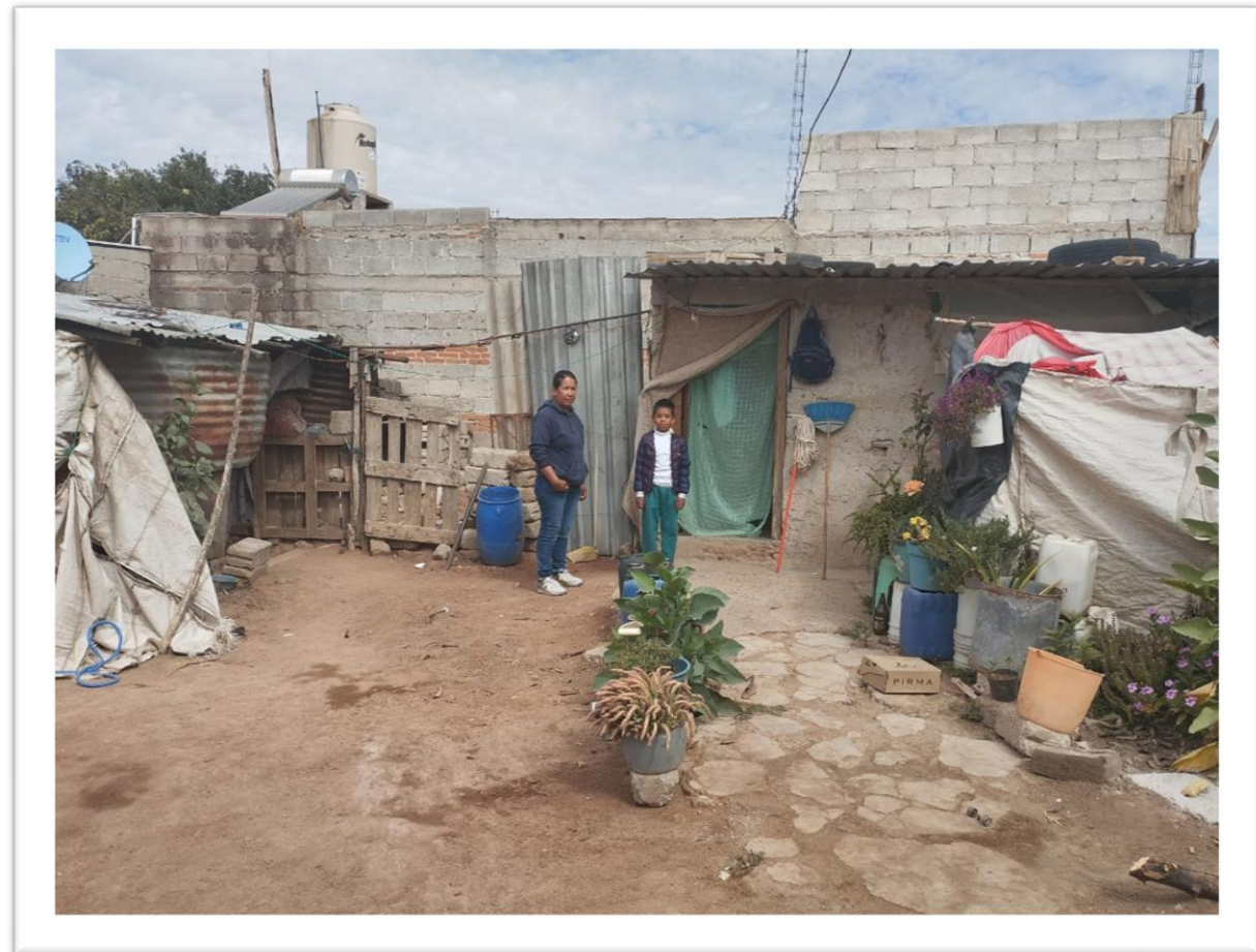
ANTES DE LA INTERVENCIÓN