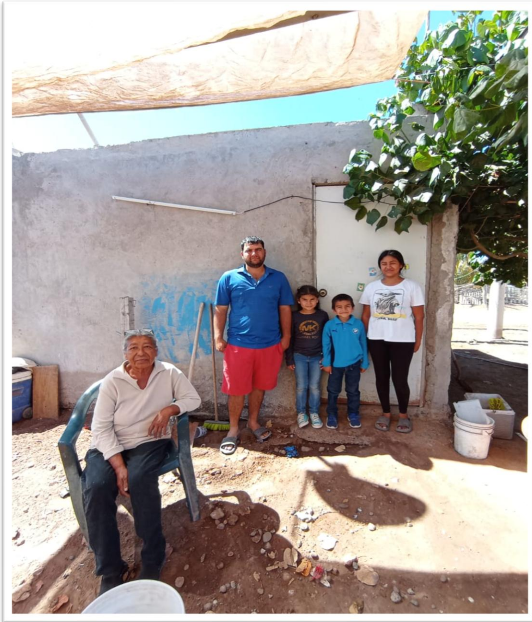
FAMILIA ÁLVARADO COTA