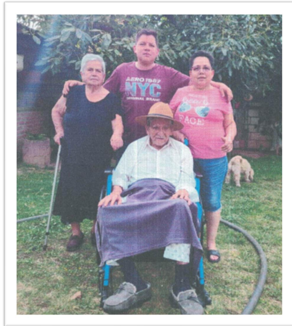
ANTES DE LA INTERVENCIÓN