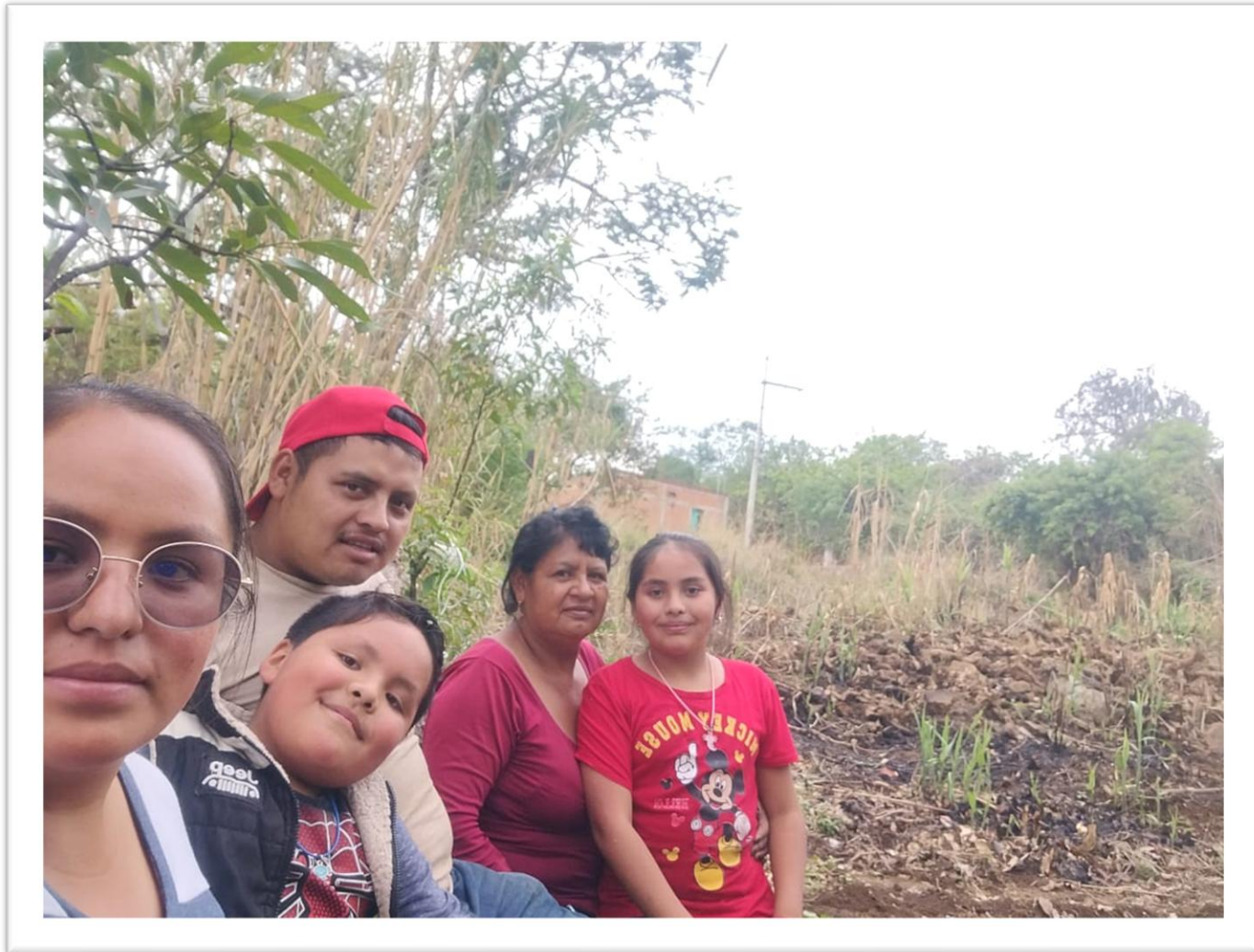
ANTES DE LA INTERVENCIÓN